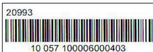
Obrázek 2 - Vzor kódu listovní zásilky

4.3.5. Číselné vyjádření kódu se tiskne typem písma Arial 7.