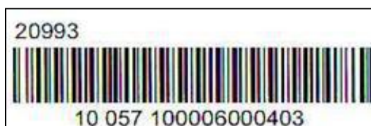
Obrázek 2 - Vzor kódu listovní zásilky

4.3.5. Číselné vyjádření kódu se tiskne typem písma Arial 7.